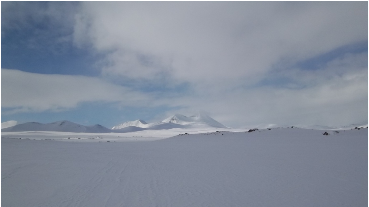
Bild: Färdväg mot Staika

Dag 2: Nästa morgon var siktet inställt mot Staika och fjällsidan mot öster. Vi hade en morgon med låga moln, lite blåsigt och begränsad sikt och eftersom vi turen gick utanför ledssystem så var jag för första gången utrustad med en Ipad, nerladdat kartsystem Sweden Topo Maps och det var riktigt kul ska jag säga!! Vi tuffade på, stannade och kollade kartan med jämna mellanrum och hade full koll på var vi befann oss. Jo, jag har erfarenhet av GPS sedan tidigare och även om en Ipad väger mer så ser man ju sååå mycket bättre.