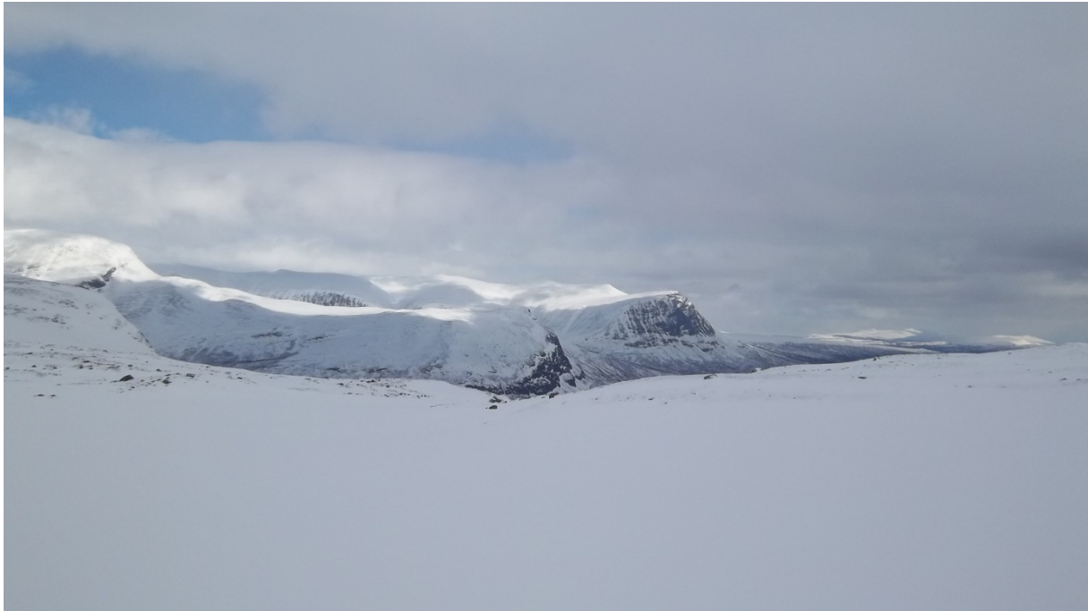
Bild: En kik bakåt, utsikt ner mot Tarradalen och Njunnjes

Dagens ospårade tur blev rätt så lång innan det var färdigt ca 4 mil, men som hundarna jobbade!