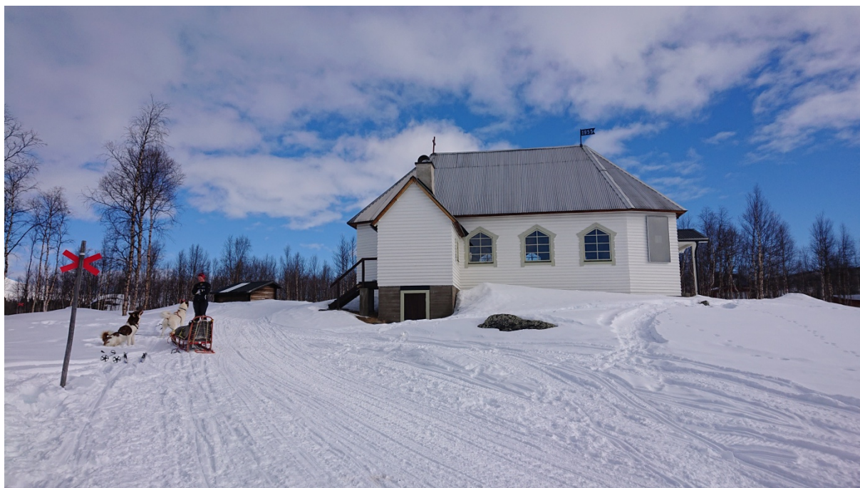
Bild: Paus vid kyrkan i Västerfjäll