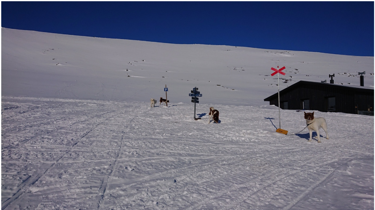
Bild: Grönlandshundar på rad vid Vaimok stugan.

Vi kom till Vaimok i stålände solsken, fick en dag då hundarna vilade, vi solande och fikade och under dagen fick vi hjälp att kika på köket av skoteråkande Pitebor. Med ytterligare rensning och byte av munstycke så fungerade köket som bara den, en så lättad-vi kunde fortsätta turen enligt planering.