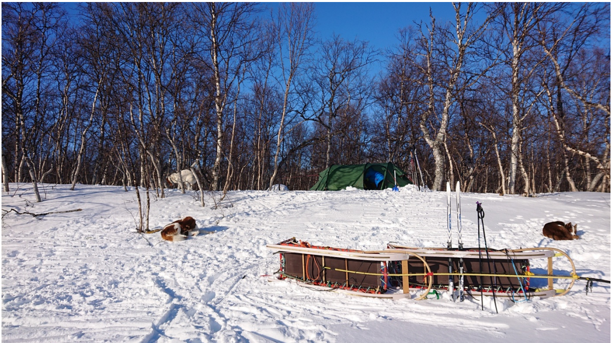
Bild: Lägerliv vid Villdo