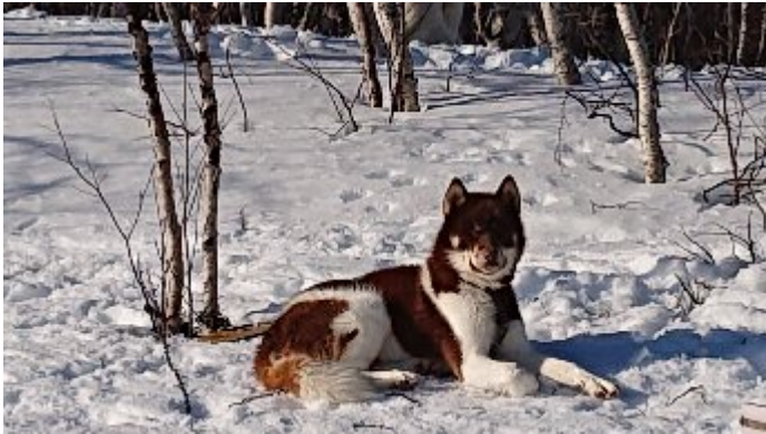
Bild: Bolt njuter i solen.

Vi tog ett sent lunchstopp vid stranden på Dödholmen, jag skojar inte det heter så! Nu var vi nere på skoterland så lederna var markerade och eftermiddagens läger gjorde vi vid en Udde på sjön Villdo.