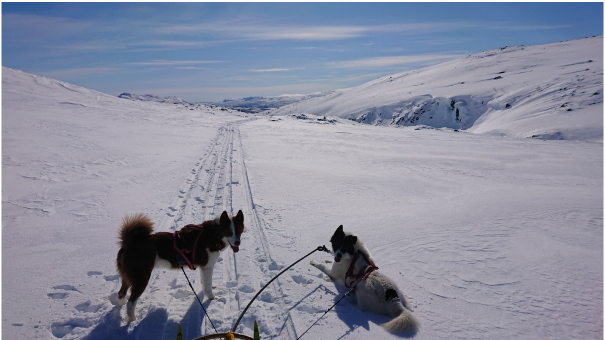
Bild: Slutet på dalgången, strax ner mor fjällbjörkskog. (Med löptik i ekipaget då nyttjar man inte nacklinan för att behålla lugnet)