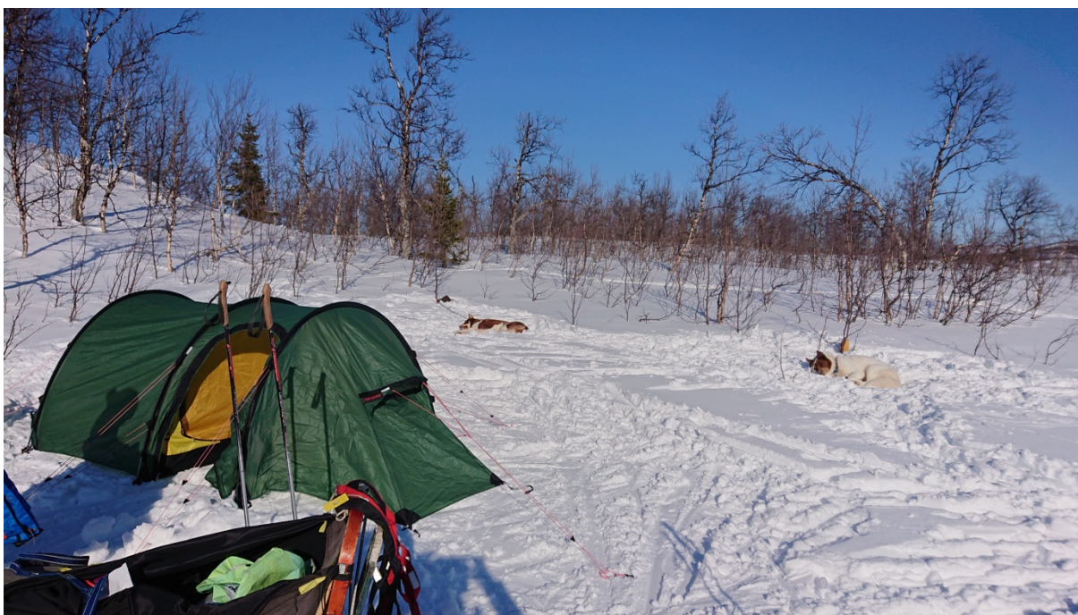
Bild: Läger vid Lastak.

Efter pausen var vi uppe på Ramekjavre och vi hade riktning norrut mot ett sjösystem som heter Lastak, fin hundkörning men inga tydliga skoterspår för de hade snöat/drevat igen under helgen som passerat. Vi slog läger efter den sista av sjöar som tillhör Lastak, en fin eftermiddag där vi satt ute i solen och både fikade och lagade middag.