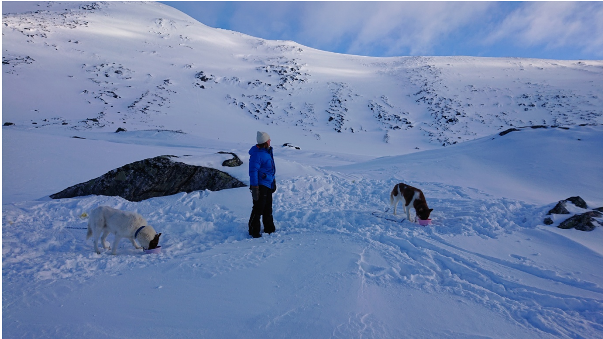
Bild: Stillhet i det blå ljuset på Kurrajaur

Dag tre: Denna morgon fick vi lite spänning- vi fick lite trubbel med bensinköket som inte riktigt ville vara med, ett kök som fungerar är ju ett måste då man gör en tur i terräng utan stugor. Så efter en stunds tjuvande så beslöt vi att äta frukost, vi hade varmt vatten i termos från gårdagen och åka de 8 km till Vaimok, där är en STF stuga för att rengöra köket en gång till. Om vi inte skulle få ordning på köket då hade det varit läge att ändra på rutten, med andra ord vända ner mott Tarradalen och Kvikkjokk och det ville vi ju inte.