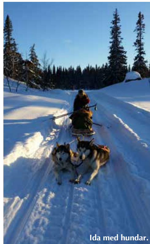
Ida med hundar.

På tisdag morgon gjorde vi oss ingen brådska, åt frukost och njöt av att vara långt från civilisationen. Sedan packade vi ihop oss och skidade med packning och hundar på ett annat spår hemåt. Två korta men helt underbara dagar, det är egentligen inte så svårt att fånga dagen!