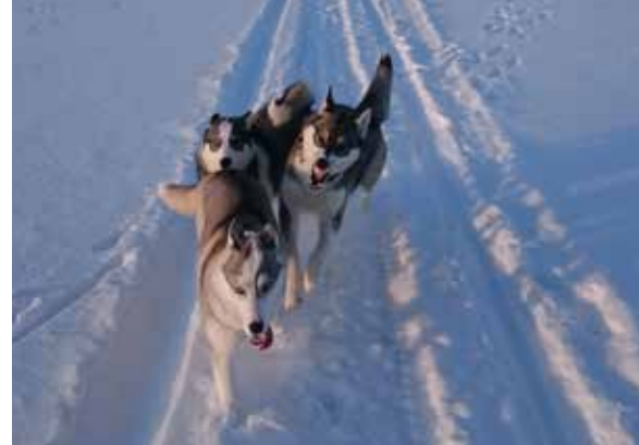
Kymcanis Mosura Kymcanis Qullqi Kymcanis Taktuq.