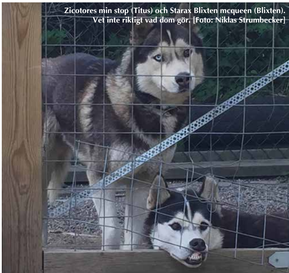
Zicotores min stop (Titus) och Starax Blixten mcqueen (Blixten). Vet inte riktigt vad dom gör.

På återhörande. Eder ordförande Malin Sundin