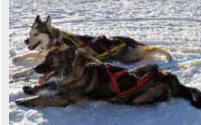
Ljusvattutjärns NH Dakota & PA Ursus.

Mina uppmaningar till Er i förra numret gav resultat. Oerhört roligt att det kom så många fina bilder och roliga och mycket intressanta artiklar ifrån Er till detta nummer. Det som inte fick plats nu kommer att komma med i kommande nummer.