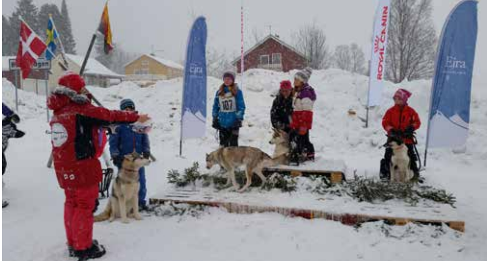
Priscermoni för barnen.