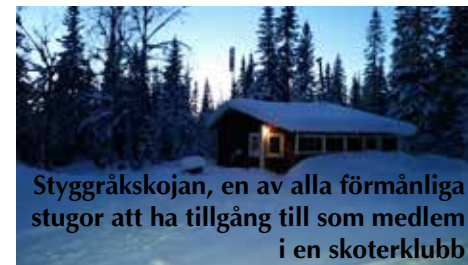
Styggråskojan, en av alla förmånliga stugor att ha tillgång till som medlem i en skoterklubb