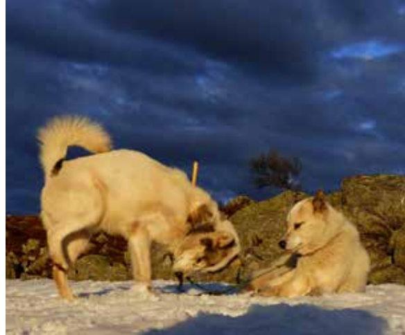
Midsommarkväll på Tandsjövålen med Grönlandshundar.

Tiden går fort när man har roligt och dessa vintermånader går fort! Min tanke inför detta nummer av Polarhunden var att bidra med material till tidningen och nu är jag både för sen i starten (manusstoppet) och kameran med bilder ligger kvar i stugan, så blir det ibland.