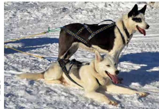
Ljusvattutjärns Nordiska Nanna liggandes bredvid Mishawum's Tecocalli Bowl (USA-imp).