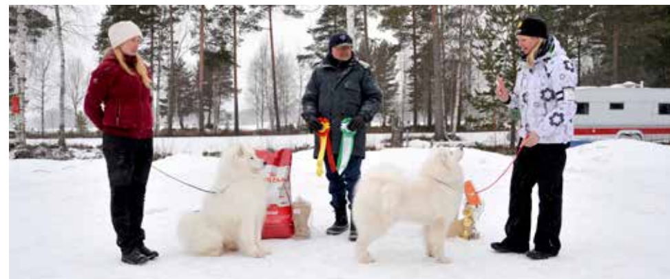
Far och dotter i BIR och BIM finalen.