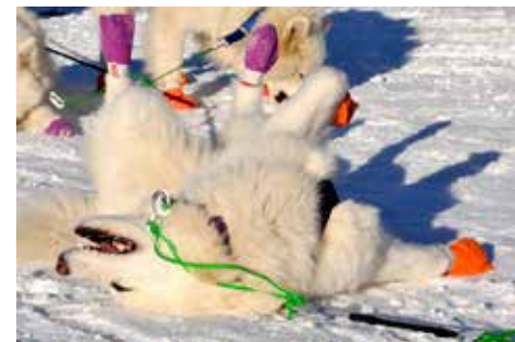
Till vänster: Två glada tikar ur Line Buans spann som njuter av solen efter målgång. Till höger: En glad å nöjd tjej ur Lars Jämtsveds team efter målgång vid DP60.