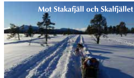
Mot Stakafjäll och Skalfjället