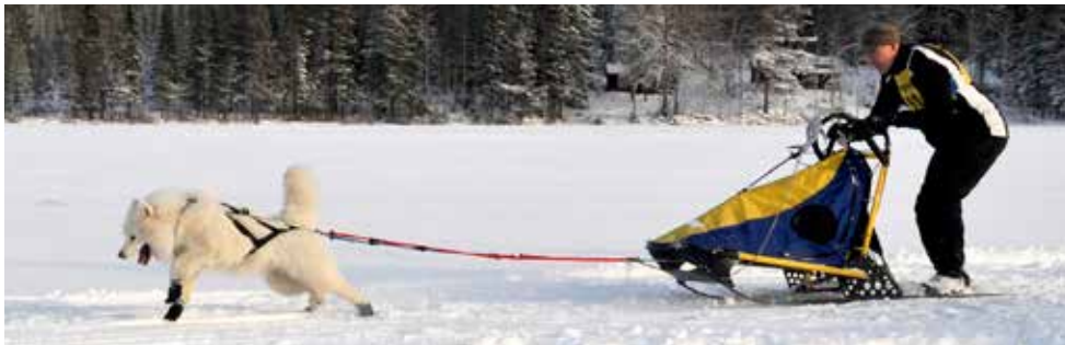
Gustaf och Frej i starten av DP10.

Under lördagens Dp10 var det tre startande varav endast en – Gustaf fick godkänd tid och en var några sekunder för sen för godkänt resultat och den tredje valde att avbryta för dagen. Under söndagen var det inga starter på DP10.