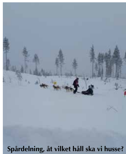
Spårdelning, åt vilket håll ska vi husse?