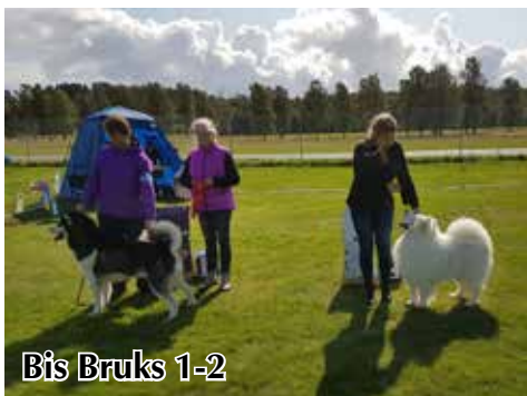
Bis Bruks 1-2