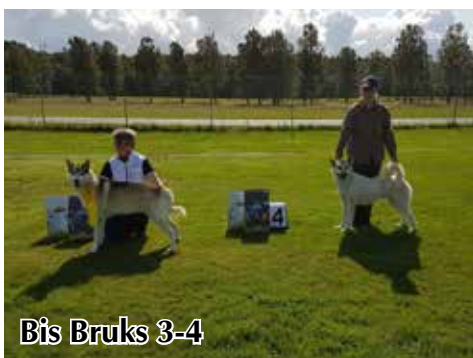
Bis Bruks 3-4