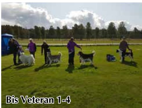
Bis Veteran 1-4