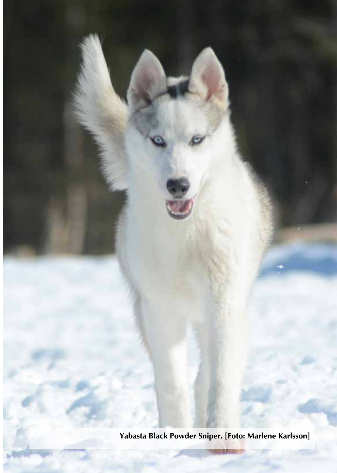
Yabasta Black Powder Sniper.

SPHK ved rasklubben for grönlandshund og NP ved avlsrådet for grönlandshund