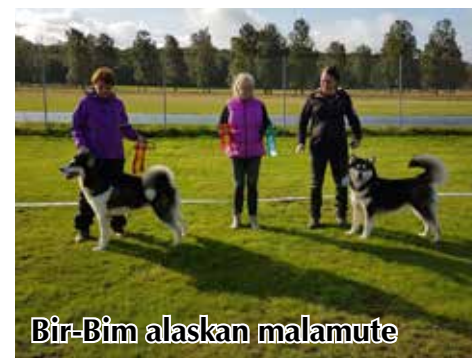
Bir-Bim alaskan malamute