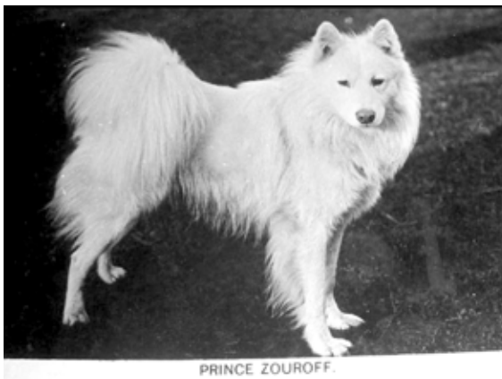
T.v: Första/andra generationen västerländskfödd samojed i England. Tidigt 1900-tal.