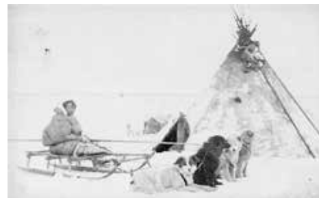
T.v: Samojediska hundar i Sibirien 1887.

I äldre rysk litteratur från början av 1900-talet där man ägnat en hel bok åt att beskriva de sibiriska slädhundarna som förekom i bl.a. tundraregionen kring Jeniseyfloden och Nova Zembla (områden som ursprungshundarna till vår ras hämtades ifrån) finns en del intressant fakta i hur fort en vanlig samojedhund sprang. I boken finner man vetenskapliga