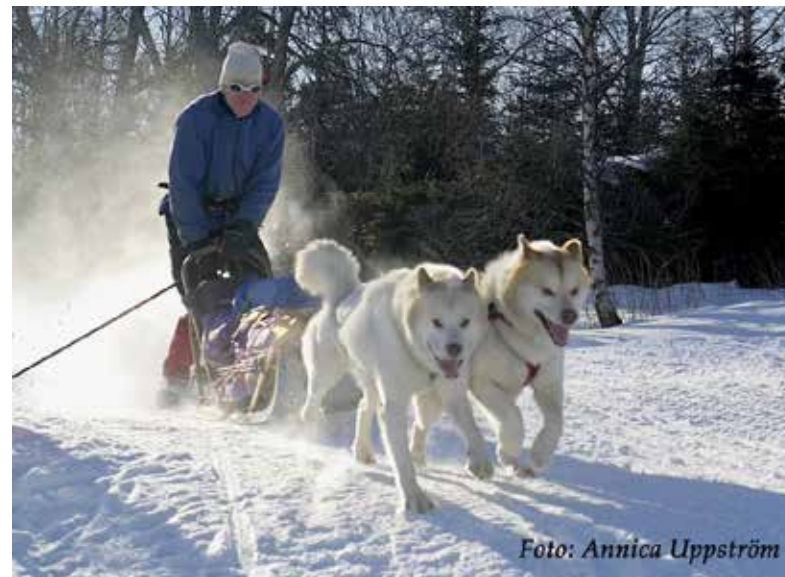
Starten vid Polardistans 300, en distans där provet Dp250+ kan avläggas. Är ett prov över 300 kilometer relevant för en grönländshund om det är rasens ursprungliga egenskaper som skall testas?

Detta prov har dessutom en fast tid som skall klaras. Med en fast tid tar man inte hänsyn till olika banprofiler, eller det faktum att snöns egenskaper förändras hela tiden. Skall man ha en fast tid måste man kunna standardisera förutsättningarna, vilket i detta fall är en omöjlighet. Det är ju inte för intet som det inte finns några rekord inom längdskidåkning.