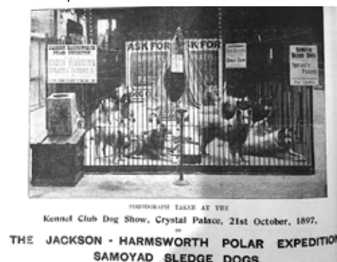
Nedan: Många av rasens ursprungshundar kom från denna expedition.

Nedan: Samojediska hundar under Duke of the Abruzzis expedition. Några hundar från denna expedition kom att utgöra några av rasens founders i västvärlden.