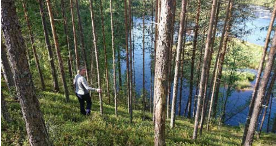
Stupet ner till vattnet ovanför Linafallet.