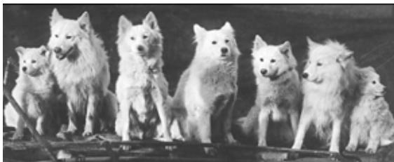
T.v: Några av de tidiga samojedhundarna i England. Från vänster till höger: Prince Zouroff, Russolene, Pearlene, Yugolene och Nansen, flankerade av valpar. Ca 1905