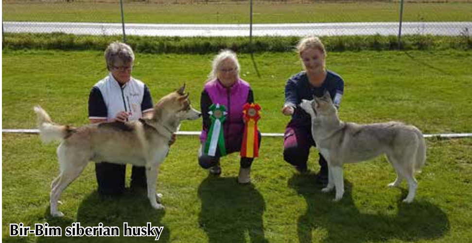
Bir-Bim siberian husky