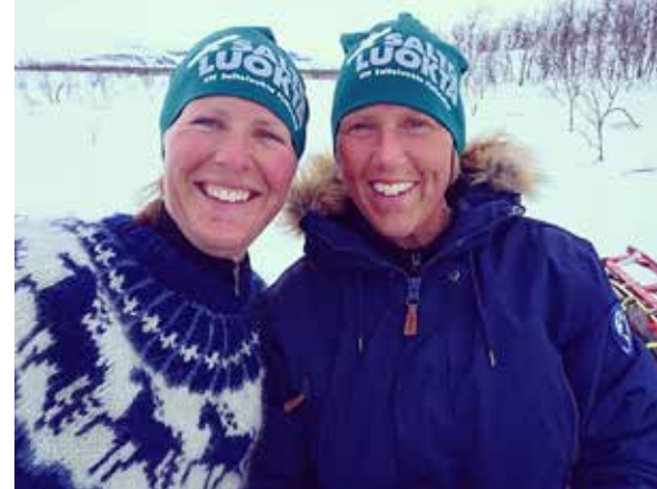
Pauser och bilder från tällivet!