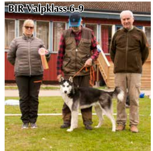
BIR Valpklass 6-9