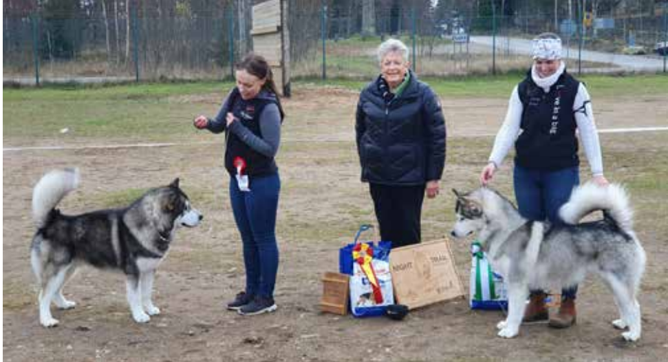
BIR och BIM BRUKS från alaskan malamute rasspecialen 2019. BIR: Awesome Earth Star deus Nix. BIM Spotty Dot's It's A Bear Thing.

nomföra. Runt 15 hundar undersöktes och i det stora hela var de flesta utan anmärkningar. Inga ärftliga sjukdomar konstaterades, men ett par fick kommentarer om förändringar i ögon t.ex. ärr efter skador.