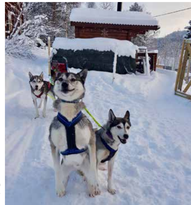
Wild Tribe's Yeti, Leia och Styxx samt Fjorgyn'z Juni.