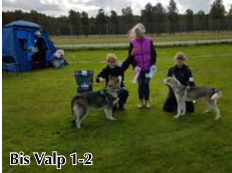
Bis Valp 1-2