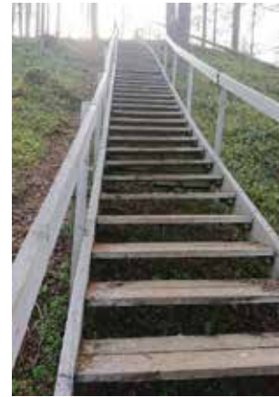
Enklare med 86 (eller 68?) trappsteg ner till forsen.