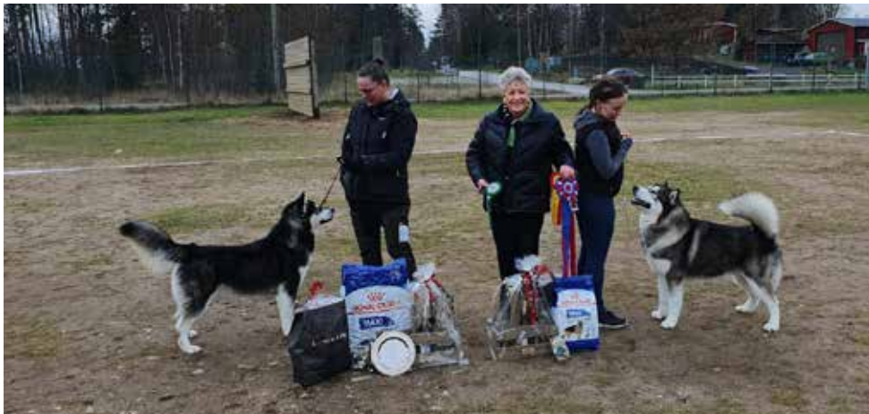
BIR och BIM från alaskan malamute rasspecialen 2019. BIR: Awesome Earth Star deus Nix. BIM Järnviljan's Surprixe Of Miki.