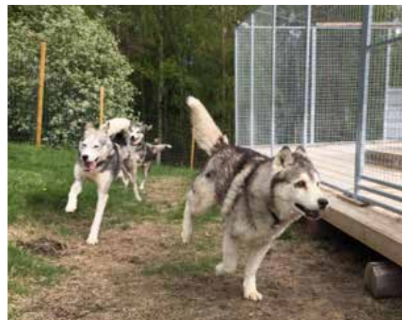
Full fart med Takoda C/Fats Domino (Dante), Wild Tribe's Tryggvold (Yeti) och Wild Tribe's Rejsa hemma i rastgården i Resele.

Alf Hallén: 0702167588 alfhallen@telia.com