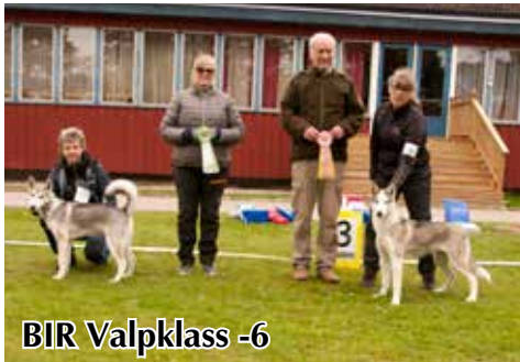
BIR Valpklass -6

hund. Det är Inte alltid den bästa hunden som vinner då kanske den bästa inte visar sig. Det är lätt att göra en bra hund sämre men en dålig hund går aldrig att göra bra.