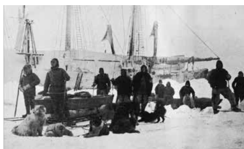
Nedan: Nansen och Johansen med sina samoje-diska hundar.