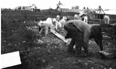
Ovan: Aleksander Ivanovitsj Tronheim med sina slädhundar.