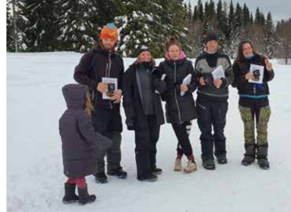
Meriteringarna i Lillholmsjö