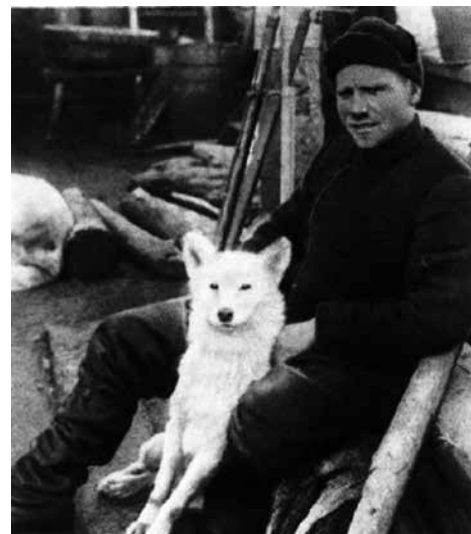
Nedan: Bild från Georgi Sedov-expeditionen. Sedovs expedition bestod av tre män och 39 hundar. Rysk expedition med samojediska hundar.