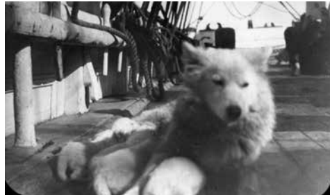
Ovan: Slädhund med sina valpar ombord på Discovery under 1901-1904-expedition.