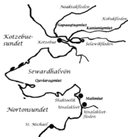
Bild 1. Platser och folkgrupper som nämns i texten