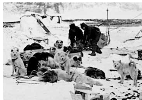
Ovan: Alexander Borisov's expedition till Novaya Zemlja 1896. Här ses också den klassiska samojediska hundtypen.