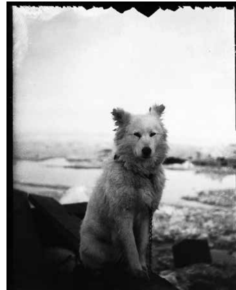
Ovan: Hund, juni 1894.