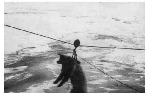
Ovan: Bilderna är från Amundsens expedition 1919.