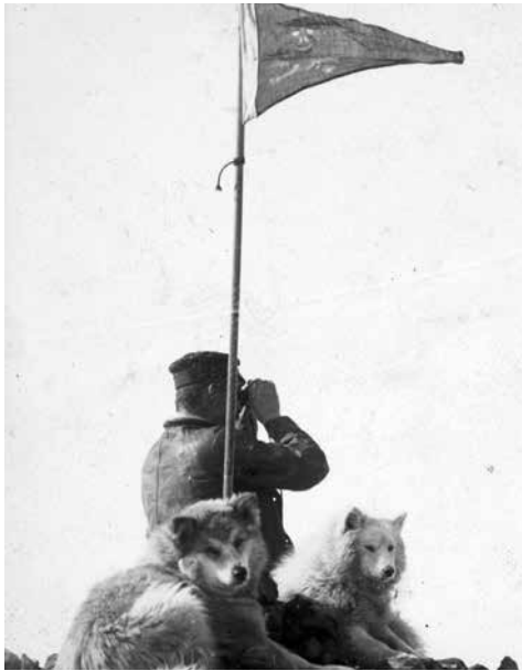
Ovan: Man med kikare, 1899, British Antarctic (Southern Cross) Expedition.