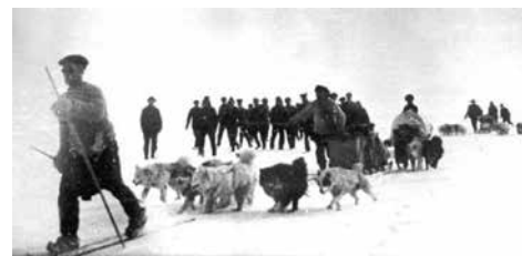
Ovan: en bild från en expedition i början av 1900-talet i trakterna kring Zevernaya Zemlja, Taymyr, Archangelsk och Jenisej i västra Sibirien. Inhemskas hundar av samojedisk/ostjakisk typ.