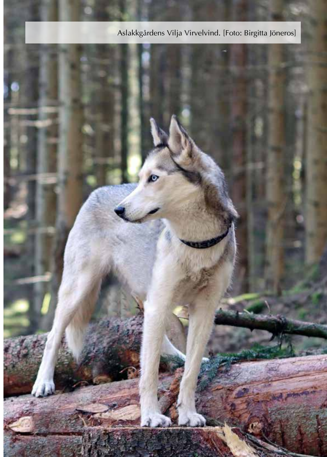
Aslakkgårdens Vilja Virvelvind.