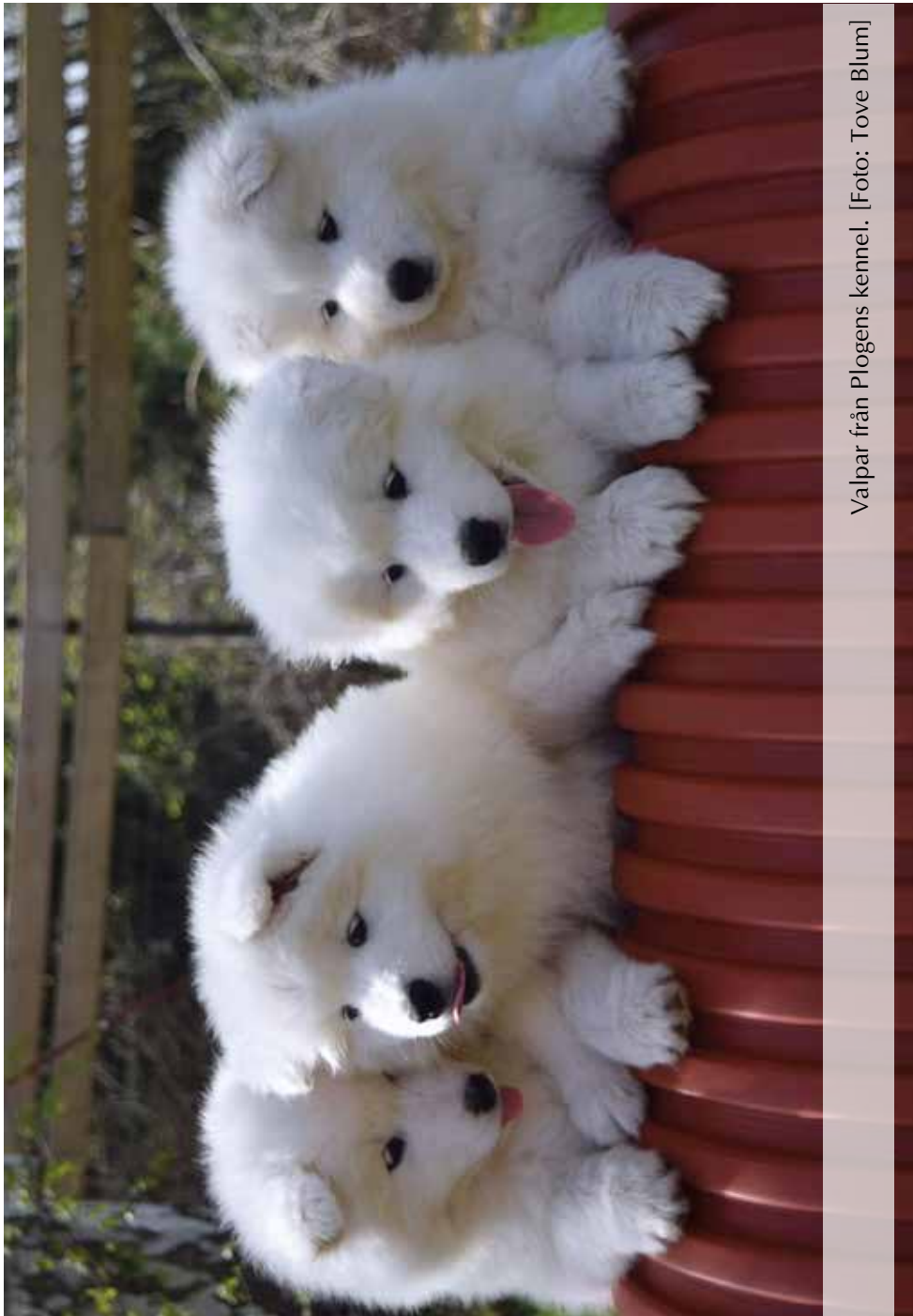
Valpar från Plogens kennel.