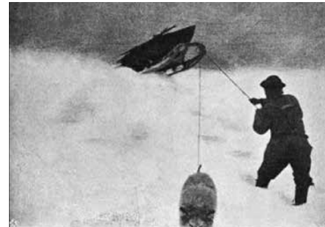
Ovan: Hjalmar Johansen: Med Nansen mot Nordpolen.