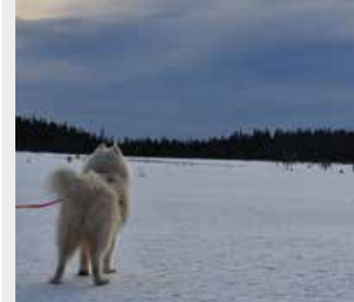
Vår charmiga samojedhane Yeti (Polarullens yeti av aarka-ja), som blickar ut över Koppången. Bilden togs i år i januari.