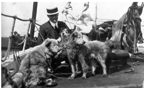
Nedan: Forskningsresande Ernst Shackleton ombord på Nimrod.