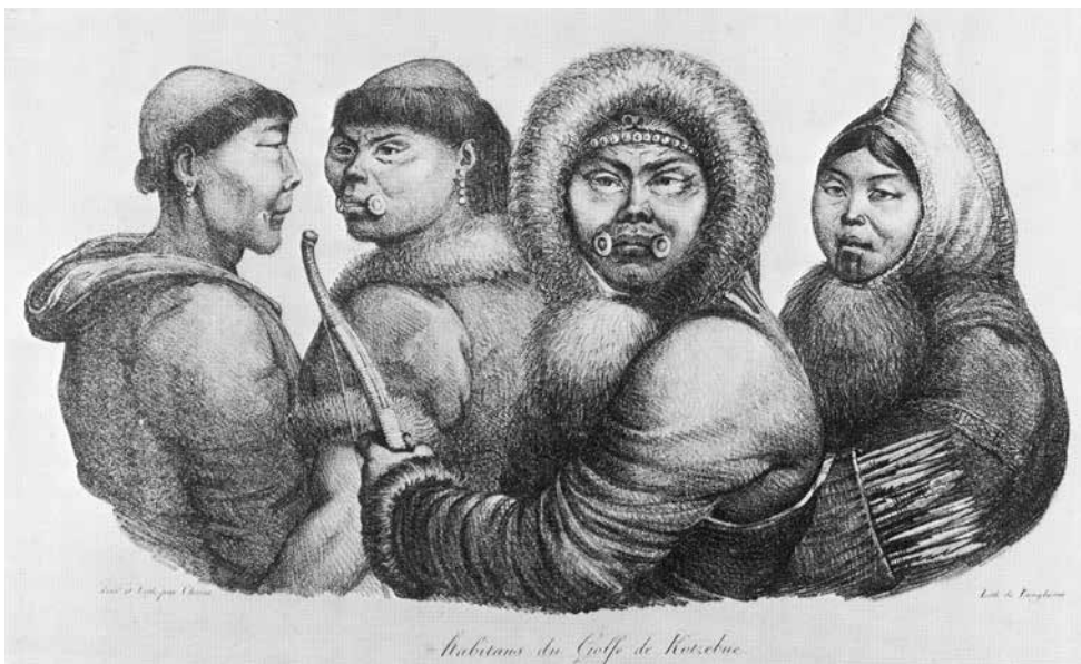
Bild 3. Eskimåer från Kotzebuesundet, 1816. Litograf av Louis Choris (från Bockstoce, 1977). Malamuter

Shaktoolik och Unalakleet utgör idag bl.a checkpoints för ekipagen i Iditarodloppet. År 2010 uppgick befolkningen i Shaktoolik till 151 personer. Det var det första ställe, som migrerande Malemüter bosatte sig 1839. Från början var byn belägen en mil uppström Shaktoolikfloden, men flyttades 1933 ner till dess mynning. Emellertid var höst- och vinterstormarna så svåra, att man flyttade till sitt nuvarande, mer skyddade läge 1967. Unalakleet hade 688 innevånare år 2010 och är idag känt för sitt lax- och krabbsfiske. Det var länge ett större handelscentrum mellan athabaskaindianer, som kom från det inre av Alaska, och Iñupiaqueskimåer som levde vid kusten.