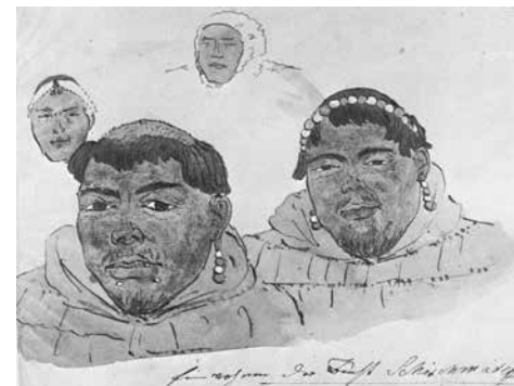
Bild 4. Eskimåer från Shishmaref Inlet, 1816. Akvarell och bläcksketch av Louis Choris (från Bockstoce, 1977). Malamuter?

Den idag rådande situationen vid Unalakleet är ganska komplicerad. Många människor i Unalakleet kallar sig själva för Malimiut och talar en dialekt av Iñupiaq, som också talas vid Kotzebuesundet. Men människorna vid detta sund