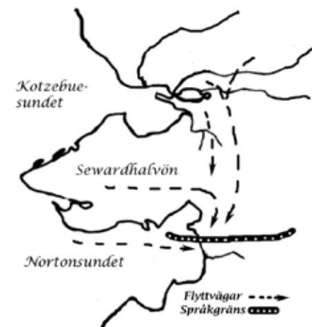
Bild 2. Folkförflyttningar över språkgränsen från Iñupiaqtalande till Yupiktalande områden

Under senare delen av 1800-talets förra hälft utbröt en smittkopps epidemi i en del av nordvästra Alaska och ett antal byar decimerades kraftigt, bl.a. Pastolik, Klikitarik och Unalakleet (Fortuine, 1989; Ray, 1964). Detta underlättade för 'Maleygymyut' att vandra in i dessa områ-