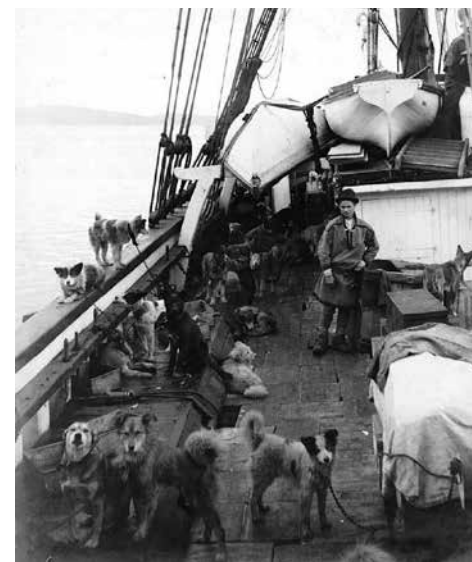
Ovan: Bild från boken "To the South Polar Regions: Expedition of 1898-1900" by Louis Bernacchi. En av deltagarna vid Carsten Borchgrevink expedition med Southern Cross.