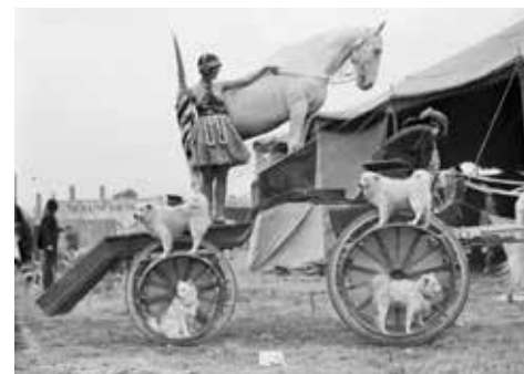
Samojedhundar på cirkus 1922.