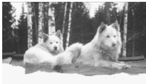
Bilden kommer från Einar Östgaard och föreställer hundarna Peik och Tommy. Einar köpte Felix 2001 som kunde spåras tillbaka till Peik som hans far på sin tid ägde. Peik var född 1912 och hans son Tommy var född 1914. På bilden ses dessa två tillsammans men det råder stor osäkerhet kring vem som är vem.