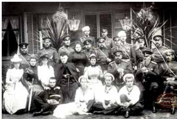
Tsar Nicholas II med familj och en av deras samojedhundar. Före 1918.

De första Samojedhundarna kom till Europa på 1870 – 80 talet och väckte åtskillig uppmärksamhet som en fläkt från den arktiska världen. I polarområdena blev hundarna värdesatta för sina bruksegenskaper, inte efter färg, ögonfärg eller andra bruksmässigt oväsentliga ting.