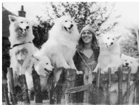
Farningham kennel i England tidigt 1900-tal.