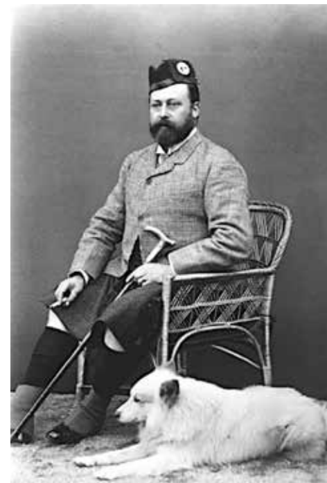
1886, German Chancellor Otto von Bismarck sände Edward, prinsen av Wales (senare kung Edward VII), en rysk samojedhund, förmodligen en av de första exemplaren av rasen i England.