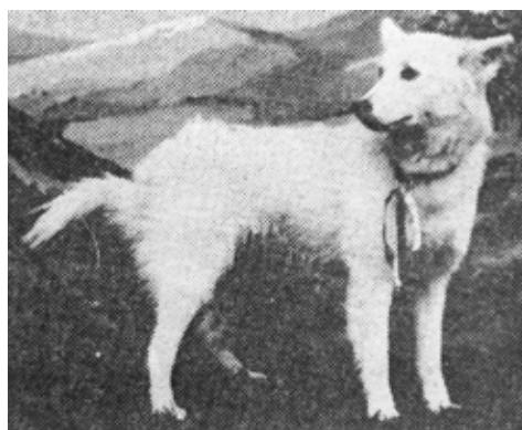
Dinka. Ibur kennels stamtik 1946.