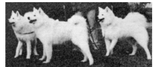
Nedan: Bäregårdens Disa 13472/79 med två barn, Angel 41481/80 och Ante 41483/80.