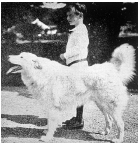
Southern Cross, 1909. En av rasens tidiga stamhundar.