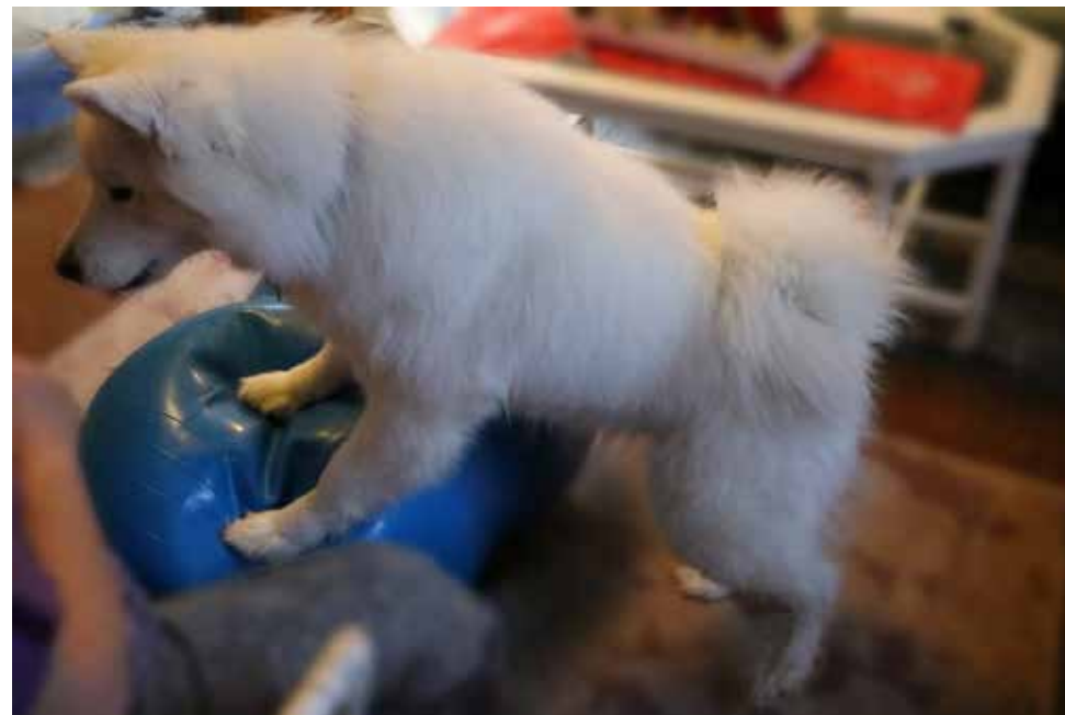
"Yaisa med två tassar på bollen" - Yaisa står med två tassar på bollen men är på väg att hoppa upp ...