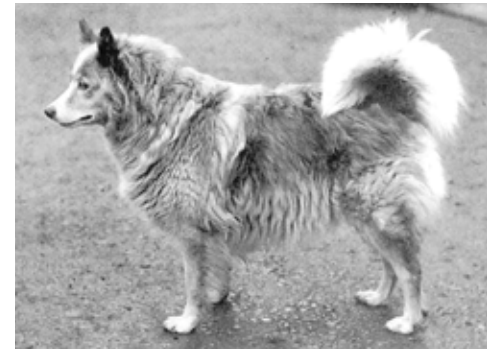
Ovan: Whitey Petchora, stamtiken för många samojedhundar.En av de tidiga sibiriska importerna som gjordes till England.