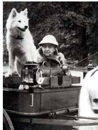
H.M. drottning Wilhelmina.