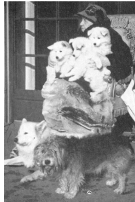
Princess Wilhelmina av Nederländerna. Ibur Stella med valpar.