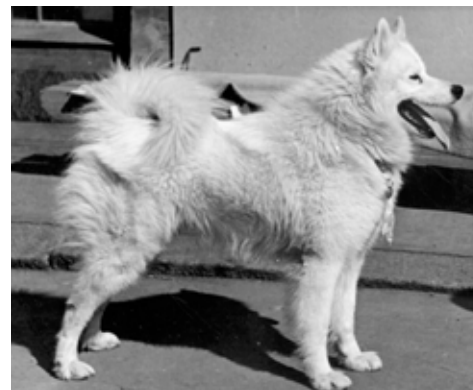
CH. Snowland Leo 1947.