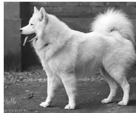
Den vinstrika och välkända hunden "Polarlight of Farningham" född 1923. Vinnare av bäst i rasen på Cruft utställningen under fem år (1925-1929).