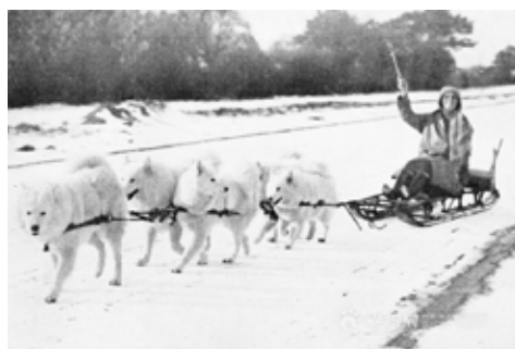
Kennel Farningham I England.