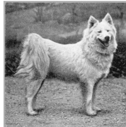
Moustan som ägdes av Prinsessan Monglyon, exporterad till USA och blev den första registrerade samojedhunden där. 1906.