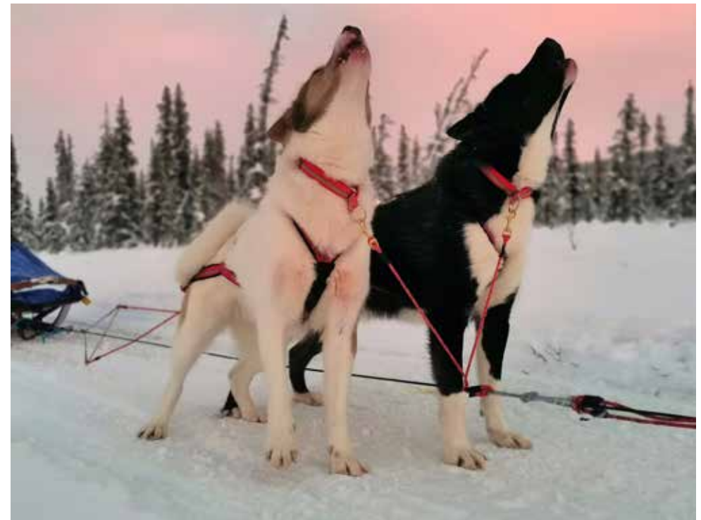
Kimassok's Northern Breeze & Pathseekers High Mountain Tjaahkk.

1,5 dygn efter att hon kommit till mig så lyckades hon smita. Förtvivlat hörde jag