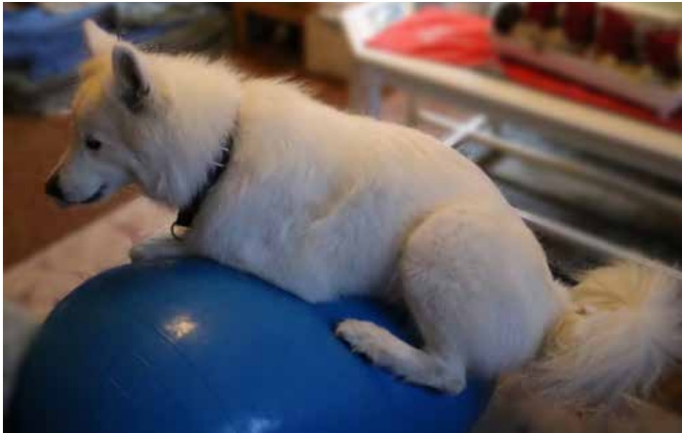
"Flinga ligger på bollen" - Här ser man att Flinga får jobba mycket mera för att hålla balansen när hon ligger ner.

svårare boll är när den är rund. Om man pumpar bollarna lite lösare blir det lättare. Något att tänka på när man skaffar balansbollar är att billigare bollar kan gå sönder med ett pang med risk för att hunden blir rejält skrämmd. De dyrare kan också gå sönder men enligt uppgift blir det då bara som en pyspunka. Hittills har ingen av våra bollar gått sönder, så de håller ändå för en hel del :)