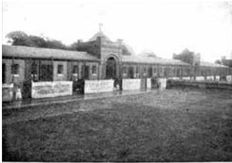
SANDRINGHAM KENNELS WITH PERLA AT HER GATE.