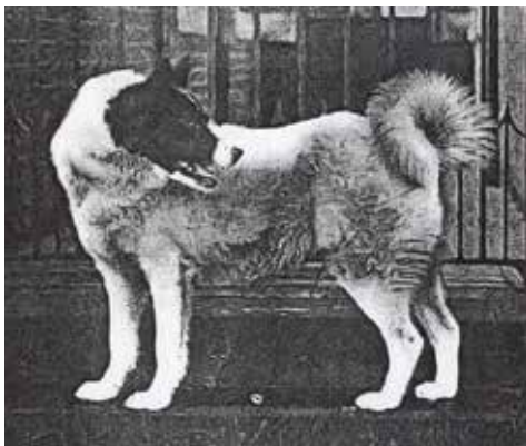
Ovan: Luska. Denna hund har vunnit flertalet gånger vid olika hundutställningar, inkluderat 1899 utställningen Cheltenham i Leicester.