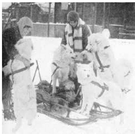
Kennel Farningham I England.