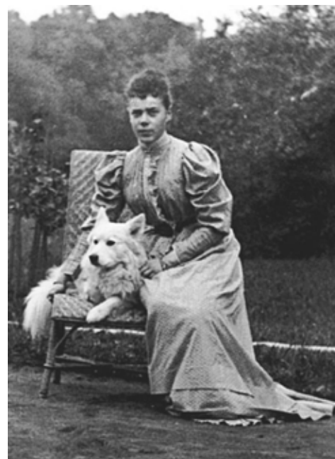
Grand Duchess Xenia Alexandrovna with med en samojedhund.