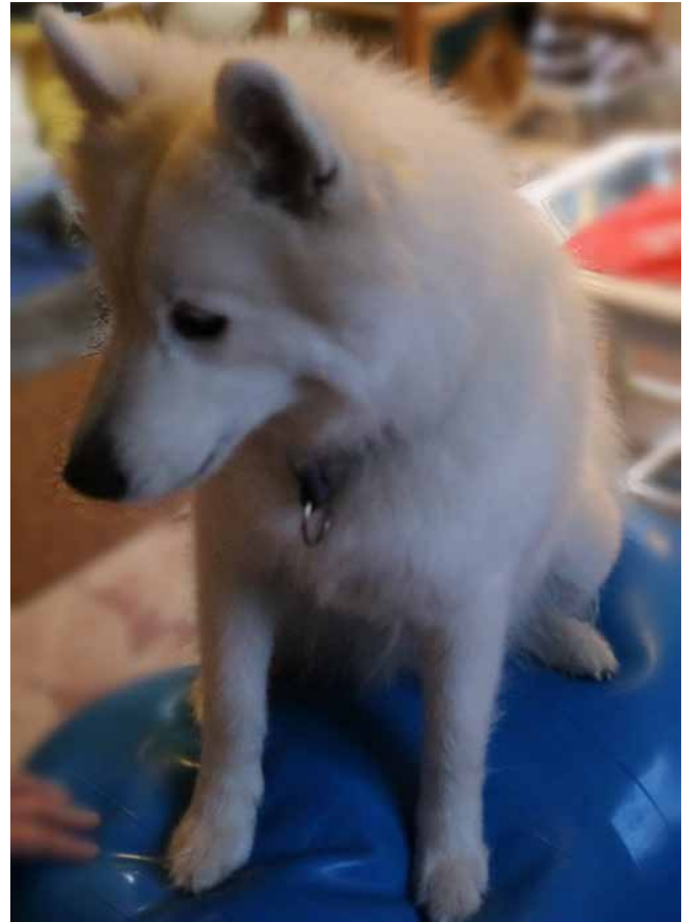
"Flinga stitter på bollen" - Flinga, 2 år, gillar att klättra och hoppa och har självmant börjat med att sitta på bollen.

När hunden har förstått vad vi vill ökar man på svårighetsgraden. Det gör man till exempel med att öka tiden på bollen, eller att hunden vinkar eller räcker fram tasserna så att den står med bara en tass på bollen. Man kan uppmuntra hunden att hoppa upp och stå på bollen eller till