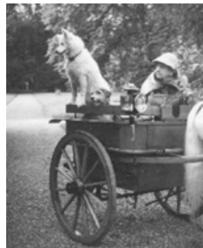
H.M. drottning Wilhelmina med Ibur Stella.