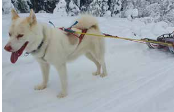
Tussaq drar en efterkälke.