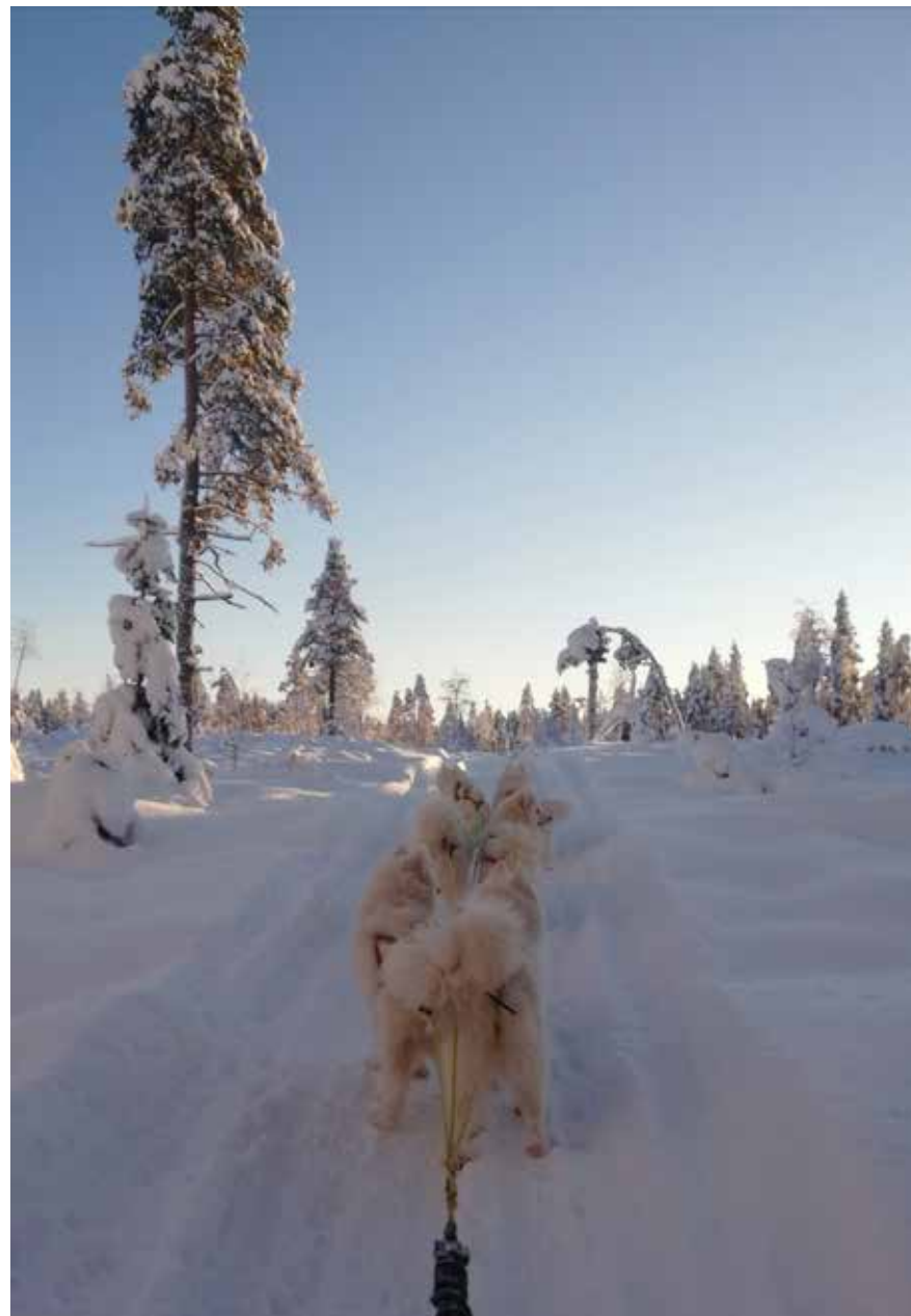
Slädtur på hemmaplan med samojederna Litoja Svea Telma Glazkova Tarisha Wintra.