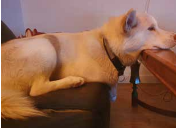
AFTERSKI med Tussaq.