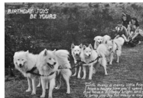
Samojedhundar på vykort i England. Kortet poststämplat 1929.