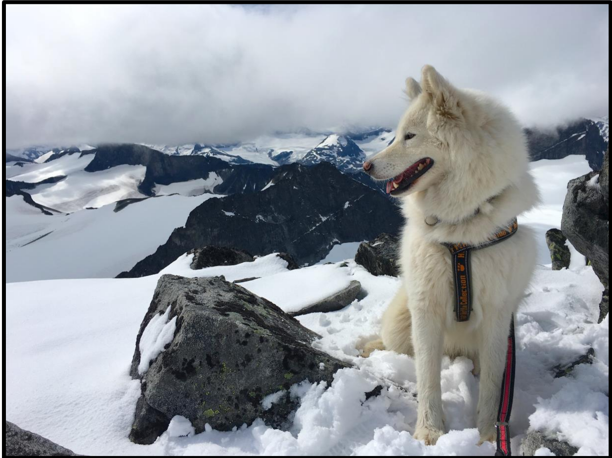
Det naturliga valet för den aktiva och friluftsintrasserade valpköparen.

Här besvaras några vanliga ställda frågor kring rasen. /SPHK: s rasklubb för samojedhund 2013. Senast uppdaterad maj 2021.