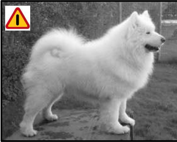
människan tycker är vackert att se på. Bild och beskrivning återges här med ägarens tillåtelse.

Till vänster: Detta är en hanhund som är SEUCH och vunnit mycket i utställningsringarna men som tyvärr fick avsluta sitt liv för tidigt då hans kroppsbyggnad orsakade honom belastnings-/förslitningsskador i boglederna på grund av hans byggnad/konstruktion, en allt för stor, bred, djup och vinklad bröstorg var enligt behandlande veterinär orsaken till de uppkomna problemen. Veterinären menade också att dessa typer av skador var vanliga på hundar med denna typ av bröstorgskonstruktion. Veterinären jämförde här med rottweiler som ofta drabbas av dessa skador på grund av sin stora och tunga bröstorg. Förutom den överdrivet stora och övervinklade bröstorggen uppvisar denna hund även ett allt för kompakt och lågställt utseende, något som missgynnar hundens funktion. Både utställningsdomare och uppfödare måste bli bättre på att bejaka de attribut som hunden ur ett djurvälståndshänseende tjänar på istället för vad den enskilda