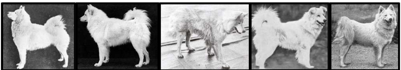
Ovan: Några av rasens mest kända sibiriska ursprungsimporter. Från vänster till höger: Houdin, Lobi, Antarctic Buck, Yugor of half way, Moustau of argenteau.

Djurstammar med 400-500 individer i effektiv populationsstorlek anses kunna överleva obegränsad tid utan allvarliga slumpmässiga förändringar av genfrekvenser vilka skulle hota stammens vitalitet. För praktiskt avelsarbete med våra hundraser är det önskvärt att inte underskrida 100 individer i effektiv population med en långsiktig strävan att nå en nivå av 200 djur. Det är därför önskvärt att avelsarbetet i raserna baseras på en medveten styrning så att de flesta familjer (linjer) bidrar med avelsdjur till nästa generation.