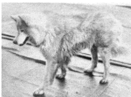
Till vänster: Antarctic Buck en av våra främsta ursprungshundar, överlevande expeditionshund efter någon av de Antarktiska polarexpeditioner med sydpolen som mål.