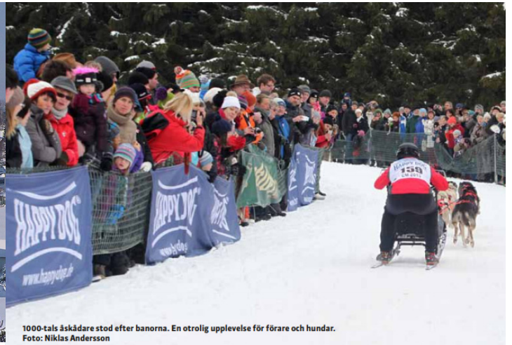
1000-tals åskådare stod efter banorna. En otrolig upplevelse för förare och hundar.